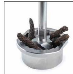
POIVRE LONG / LONG PEPPER