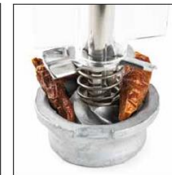
PIMENT / CHILI PEPPER