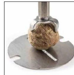
MUSCADE / NUTMEG