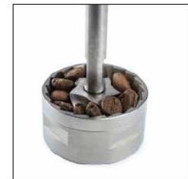
CAFÉ / COFFEE