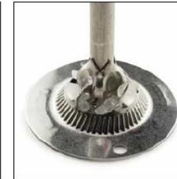
SEL / SALT