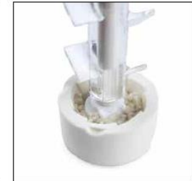
SEL HUMIDE / WET SEA SALT