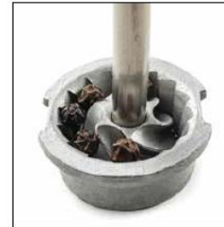
POIVRE / PEPPER