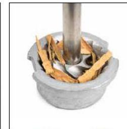
CANNELLE / CINNAMON