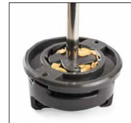
GRAINE DE LIN / FLAX SEED